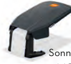
Sonnendach dunkelgrau - iMOW® EVO 5,6,7