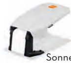
Sonnendach hellgrau - iMOW® 5,6,7